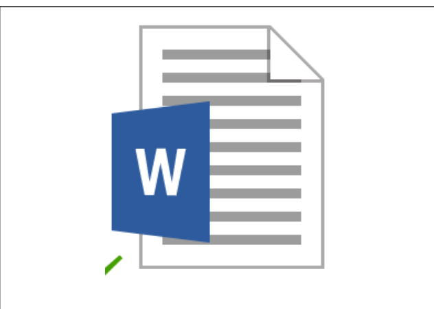
Figura 6- Icona di un documento creato con Word 2013.