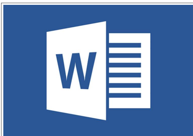
Figura 5- Icona del programma Word 2013.

Prima di passare ad esaminare come si presenta il programma Word e a conoscere come funziona, osserva attentamente: